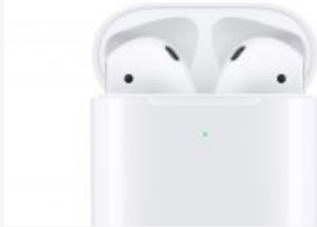
Hightech Apple lance sa 2e génération d'Airpods