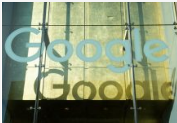
Hightech Moteur de recherche: Google dévoile des changements pour amadouer l'UE - Publicité -