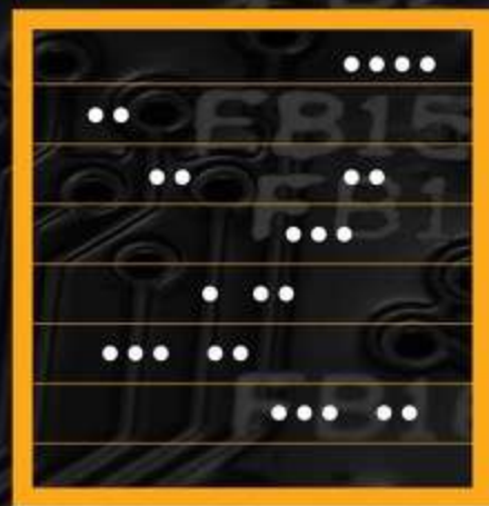
SOUS-TRAITANT (DATA PROCESSOR)