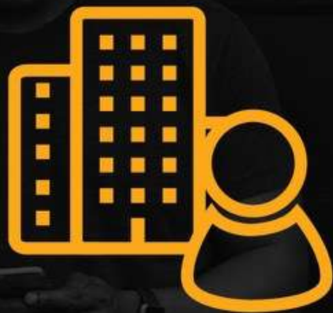
RESPONSABLE DU TRAITEMENT (DATA CONTROLLER)